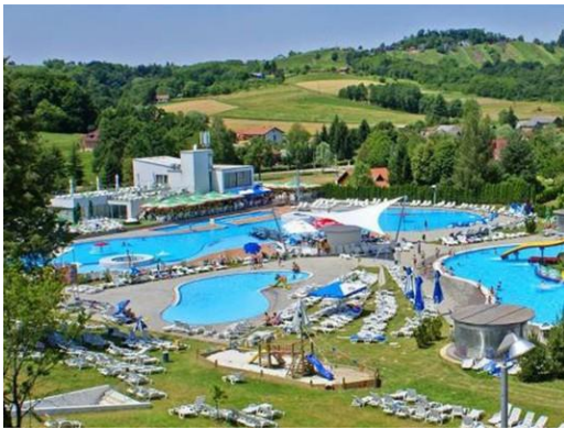
Sveti Martin Spa